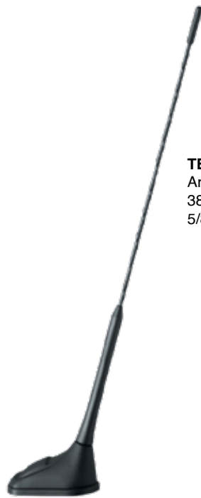
TETRA GPS Art. 7620106/H 380-510 MHz, 5/8 Lambda