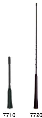
200er Shark Antenne