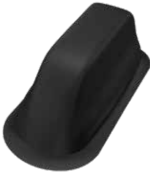
180er Shark Antenne