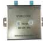
130er Tetra Weiche