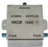
Hybrid Koppler Art. 15460 380-520 MHz