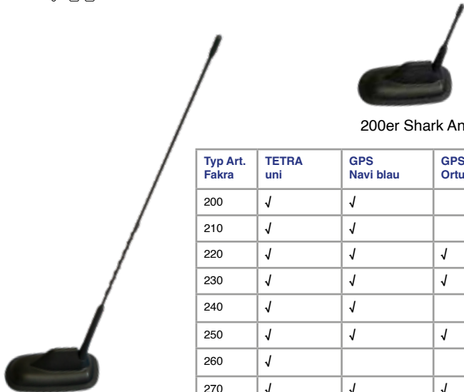
200er Shark Antenne