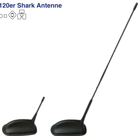
120er Shark Antennen