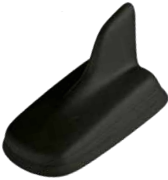
130er Shark Antenne