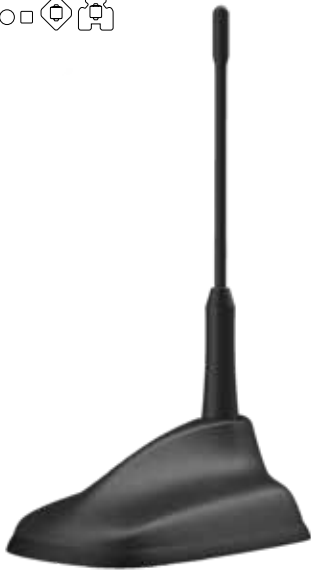
140er Kombi Antenne