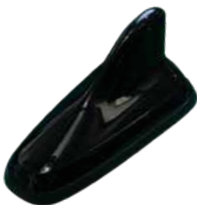
150er Shark Antenne